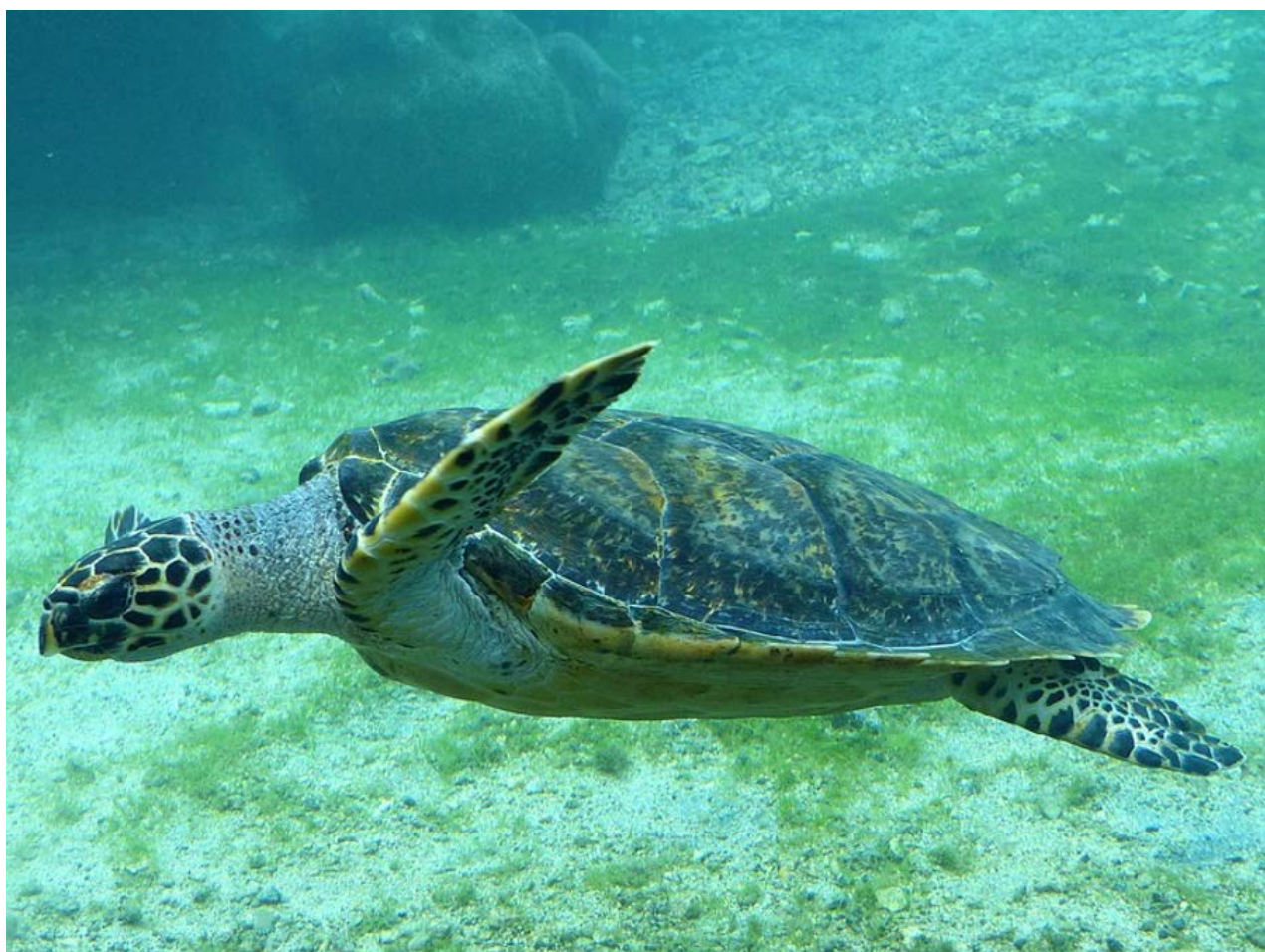
Tortue imbriquée, Eretmochelys imbricata

Agir en faveur de la faune sauvage et des écosystèmes