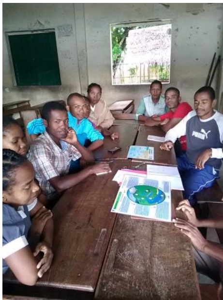
Des enseignants aux enfants, tous au cœur du cycle de l'eau!

Elle s'est adressée d'abord à tous les enseignants des classes primaires puis aux élèves de CM2 à l'École Primaire Publique de Manompana.