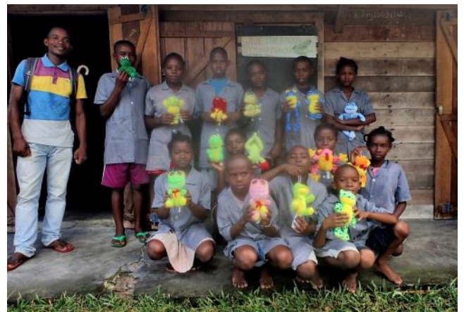
Les jeunes lauréats ont été récompensés

Pour encourager les enfants et leur faire apprécier ces journées d'animation, les activités ludiques (quizz, courses de saut en hauteur et course de grenouilles) ont été récompensées.