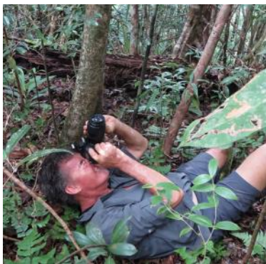
De la difficulté d'être photographe animalier