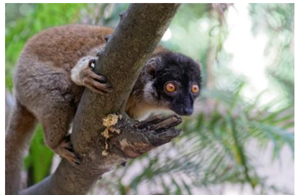
L'équipe du trek et un lémurien curieux...

Las, en cette saison habituellement propice, les orchidées n'étaient pas au rendez-vous. Aucune observation!!! Peut-être un effet du changement climatique.