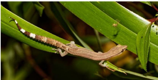
Magnifique gecko Ebenavia inunguis